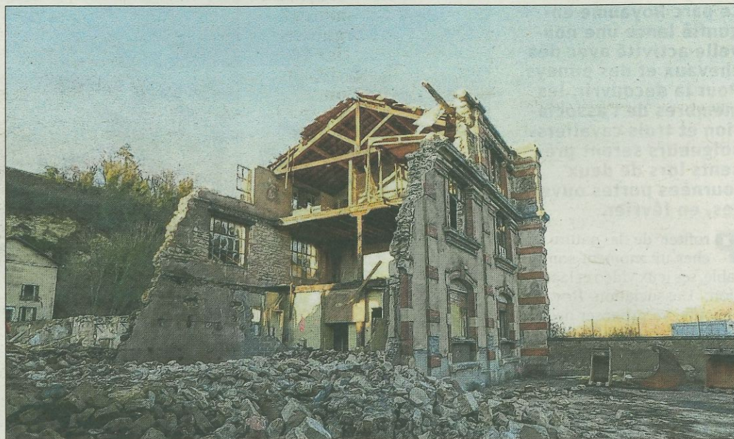
Créée au début des Trente Glorieuses par quatre frères italiens, l'entreprise Milandri Frères était spécialisée dans les travaux publics et la sous-traitance pour les grosses usines.

En 1946, quatre frères venus d'Italie achètent une partie de ces locaux. « Ils occu-