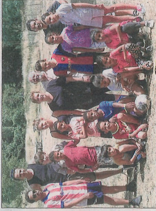
Rencontre autour du ballon rond.

L'association de solidarité avec le peuple sahraoui (ASPS Lorraine) a invité, pour la quatrième année consécutive, huit enfants sahraouis âgés d'une dizaine d'années à passer un peu de temps en Lorraine. Ces jeunes étrangers sont nés et vivent dans des camps de réfugiés situés en Algérie.